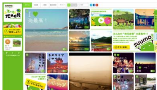
「スーモ地元自慢」PCサイトイメージ

本サイトは、日本全国を対象に、その土地を知る地元の方が「自慢できるちょっとした日常風景」の写真サイトをコピーとともに投稿し、地元を“プレゼンテーション”していただくこと、また閲覧者の方々が日本全国の地元写真を閲覧することで、各地の魅力を発掘・発信し、家そのものだけでなく街を含めた住まい選びのイメージを作っていただくことを目的としています。