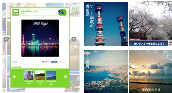
詳細ページイメージ

投稿サイトでは、全国から自慢の写真を募集します。モチーフは、その土地にまつわるものであれば何でもOK。景色・街並みやお店、グルメやいきものなどテーマを選択することもできます。「シネマ」「ニュース」「詩人」「レコードジャケット」など好きなスタイルを6種類から選択すると、写真の色調とコピーのフォントに反映されたオリジナル画像が生成されます。都道府県を選択したり、詳細な地名も任意で入力して投稿していただけます。投稿はPC、スマートフォンのどちらからでも行えます。