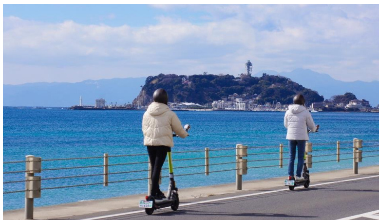
（写真）電動キックボード乗車イメージ

また，アプリによる無人でのレンタルを行うほか，GPSによる速度制限や走行可能範囲等，システムによる安全対策も実施します。詳細は別紙のとおりです。