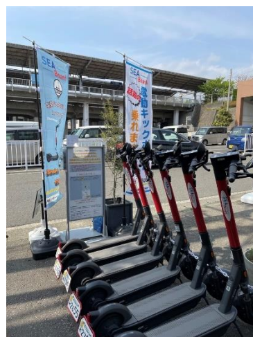
（写真）三浦海岸駅前ポート