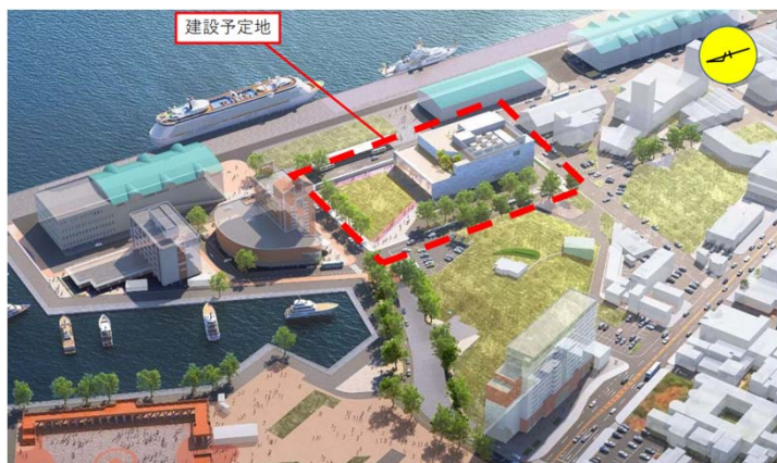
建設予定地イメージ