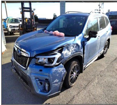
2019年式、フォレスター