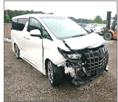
2020年式、アルファード