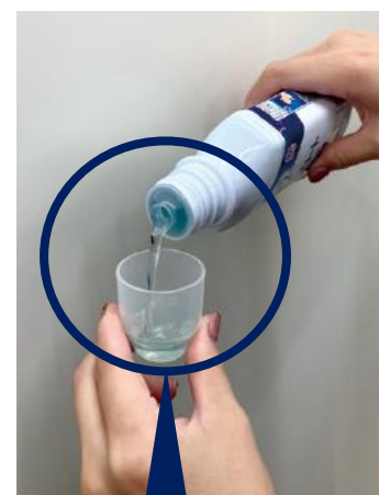
注ぎ口が細すぎないので液が出しやすい