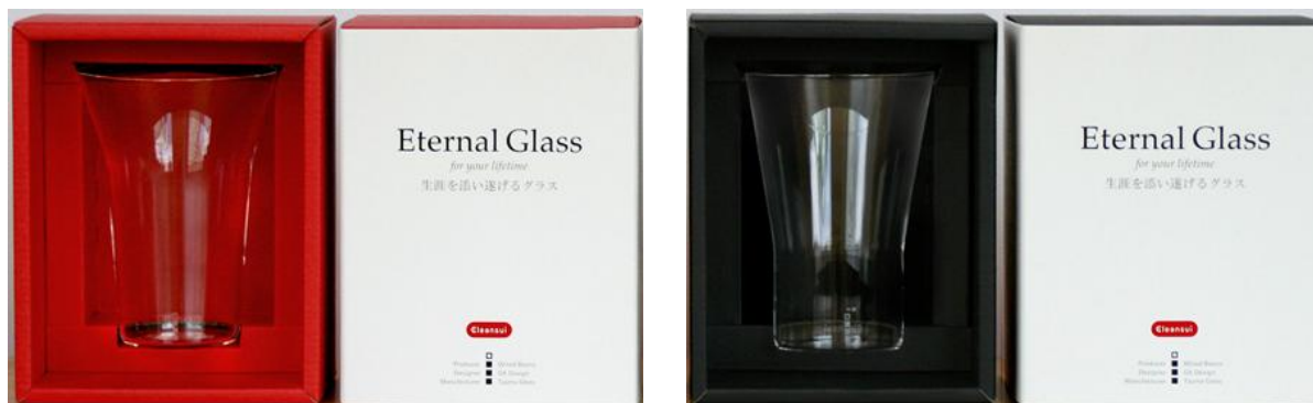
種類によって異なる色の箱に入れて販売する MIZU グラス 2 種 (左：上部にくびれがあるデザイン<赤色の包装箱>、右：中央部にくびれがあるデザイン<黒色の包装箱>)