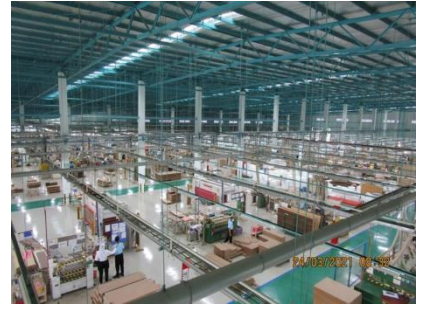
工場内観 (PT.AST Indonesia)