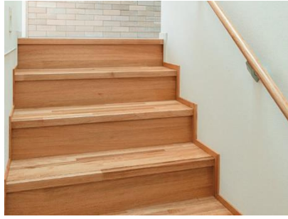
階段部材 (PT.Sinar Rimba Pasifik 製)