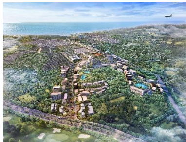
<第2弾>スマレコンマカッサル 開発エリア一帯(イメージ)