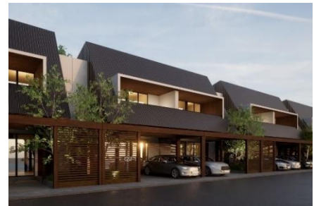
<第3弾>GPI社と共同開発する住宅 (完成イメージ)