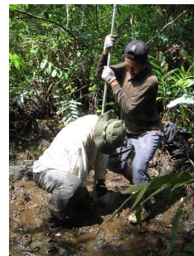
泥炭地水位のモニタリング風景