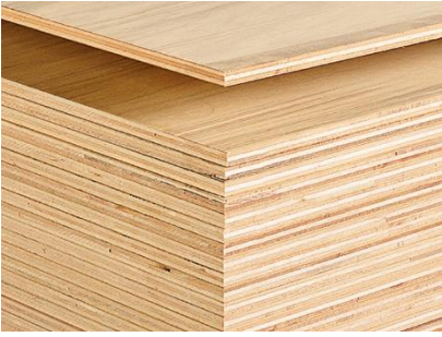
合板 (PT.Kutai Timber Indonesia 製)