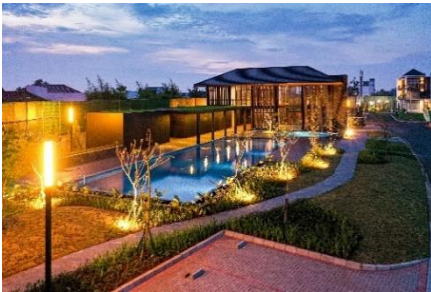
<第1弾>スマレコンブカシ 住民が利用できるクラブハウスの外観

ジャカルタ郊外デボック市で約 57,000 m 2 の敷地に約 350 戸の住宅を開発。現地不動産開発会社 PT. Graha Perdana Indah との共同プロジェクトです。スマレコンマカッサル同様、「EDGE 認証」を取得するなど環境に配慮した開発を進めるほか、住友林業が国内外で培った設計・施工技術を一部導入し、災害等にも強い快適で安全性の高い住まいを提供しています。着工は2024年1月、竣工は2026年の予定です。