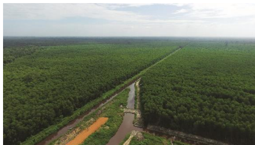
インドネシアで管理する泥炭地

※参考リリース: https://sfc.jp/information/news/2023/2023-01-31.html