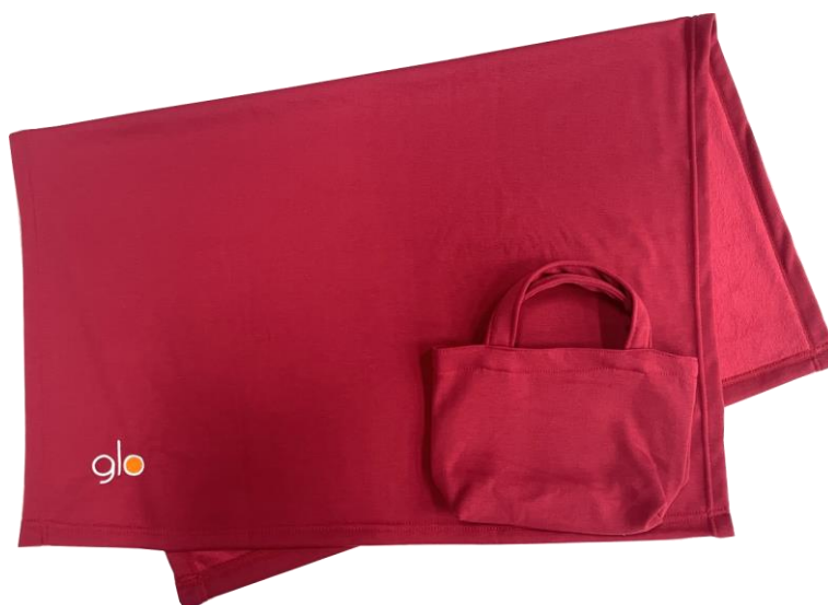
バッグ付き フリースブランケット

glo™公式ウェブサイトへ新規会員登録、および LINE 公式アカウントとの連携を行っていただいた方に、glo™ロゴ入りのバッグ付きフリースブランケットを先着プレゼントします。無くなり次第終了となります。