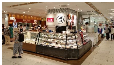
地元老舗総菜屋「佃浅」