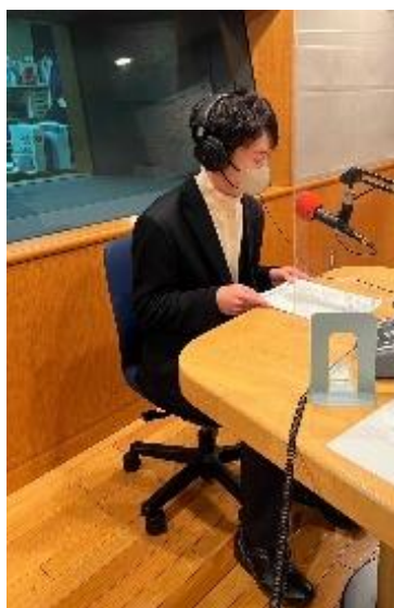
ラジオブースイメージ