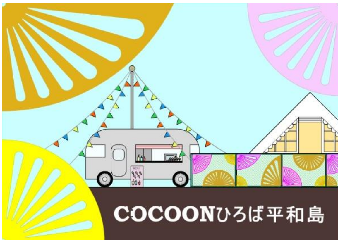
フェンスデザインイメージ

空間デザインでは、テーマである「ぽかぽか」をイメージした装飾を行います。会場内には大きなテントを設置し絨毯を広げてクッションを並べ、リラックス空間を演出します。また、日本工学院ミュージックカレッジ コンサート・イベント科とテクノロジーカレッジ 建築設計科がコラボし、COCOON ひろば平和島のフェンスの装飾を行います。フェンスの装飾はイベント後も継続設置するので、イベント終了後も余韻を楽しむことができます。