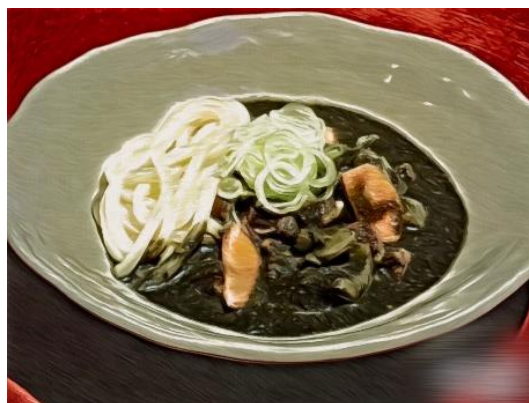
コラボメニューイメージ