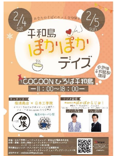
ポスターイメージ