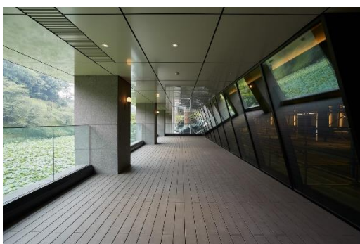
九段会館テラス設置の様子（1階テラス部分）

今回、日本のオフィスビルへの初めての本格導入となった九段会館テラスでは、1階のオフィスエントランスや、各エリアへの結節点となるプラザ、地下1階の外装面に複層ガラスとして設置されています。建物屋上に設置したセンサーなどの各種データや AI を利用し、ガラスの透過率を自動調整して、室内に差し込む自然光・熱量を日中にわたり最適化しています。これによりブラインド等の日除けを使わずに皇居外苑緑地が望める眺望を確保しながら、空調や照明によるエネルギー消費量の削減を可能にしています。