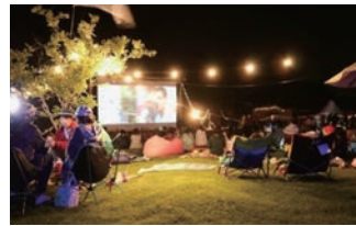
▲昨年9月の実施の様子