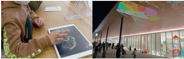
▲昨年1月の実施の様子