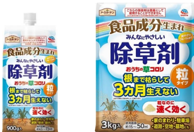
『アースガーデン おうちの草コロリ 粒タイプ』

アース製薬株式会社（本社：東京都千代田区、社長：川端克直、以下「アース製薬」）は1月20日（金）、園芸用品ブランド「アースガーデン」から、食品成分生まれの除草剤『おうちの草コロリ 粒タイプ』を全国で発売します。