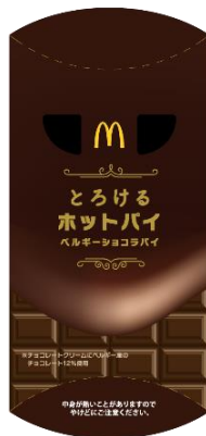
＜ベルギーショコラパイ＞