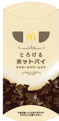
＜クッキー&クリームパイ＞

「クッキー&クリームパイ」と「ベルギーショコラパイ」の商品パッケージは、自分へのごほうびをイメージした高級感溢れるシックなデザインで、数量限定で提供いたします。2つの「とろけるホットパイ」を、見た目と味わいの両方からお楽しみください。