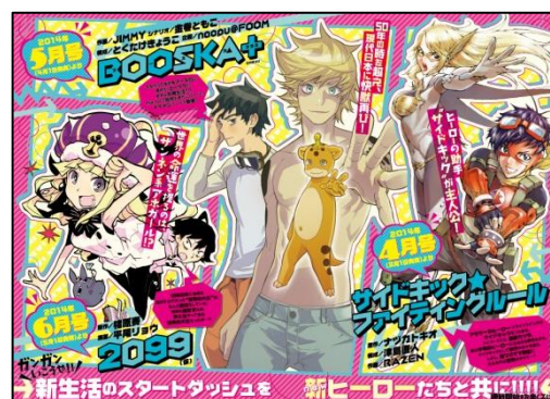
「ヒーローズ」3月号 新連載紹介ページ