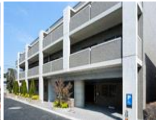
グランフォレスト目白