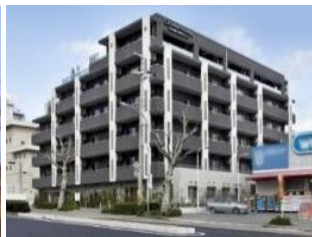
グランフォレスト神戸六甲