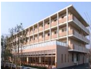
グランフォレストしずおか葵の森