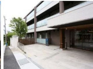
グランフォレスト神戸御影