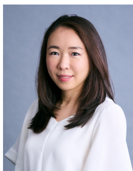
株式会社ミツモア 創業者 兼 代表取締役CEO