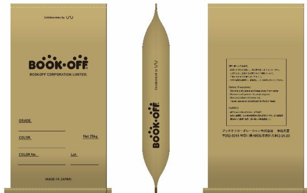
納品形態イメージ