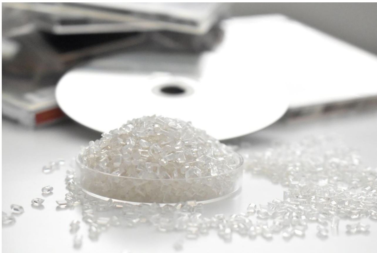
CD・DVD から再生したプラスチック資材「CD プラ」

■ブックオフブランド「CD プラ」詳細、販売ウェブサイト: https://www.bookoff.co.jp/buy/sustainable/