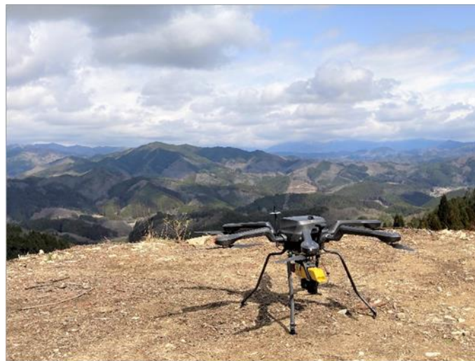
ドローン撮影の様子

岡山県真庭市（市長：太田 昇 以下、真庭市）、西日本電信電話株式会社 岡山支店（支店長：西川 智洋 以下、NTT 西日本岡山支店）、株式会社地域創生 Co デザイン研究所（代表取締役所長：木上 秀則 以下、地域創生 Co デザイン研究所）、および住友林業株式会社（社長：光吉 敏郎 以下、住友林業）は、持続可能な森林経営に向けて真庭市の森林情報をデジタル化し CO 2 吸収量を「見える化」する共同実証を実施しました。森林の価値を適切に評価し、質の高いカーボンクレジットを創出することで森林価値向上をめざします。