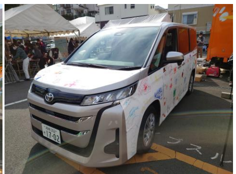
カーペイント後の車両