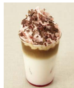
スイートでキュートな バレンタイン限定ドリンク

期間: 2014年2月1日(土)~14日(金) 8:00~23:00(ラストオーダー22:30) 場所: グランフロント大阪北館 ナレッジキャピタル 1階「カフェラボ」 価格: 各 530円(税込み)