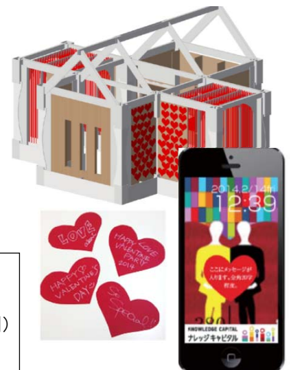
「みんなで作っていく赤いハート」のバレンタインハウス。記念フォトをプレゼント。

ハート型のダンボールのメッセージカードに大切な人への想いを書き、ダンボールアートのペーパーハウス「バレンタインハウス」の家に貼って彩るワークショップを開催します。また、特別なソファに座り、プロのカメラマンによるフォト撮影を行います。撮影した写真は、ナレッジフォトフレームに入れてメッセージとともに、携帯電話やスマートフォンにメールで14日(金)のバレンタインデーに合わせてプレゼントします。