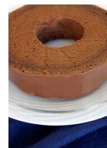
ユーハイムのチョコレート バームクーヘン