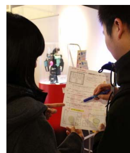
15の展示ブースを体験しながらクイズに答えよう!

期間: 2014年2月1日(土)~14日(金) 10:00~21:00 場所: グランフロント大阪北館 ナレッジキャピタル 2、3階「アクティブラボ」 参加料: 無料