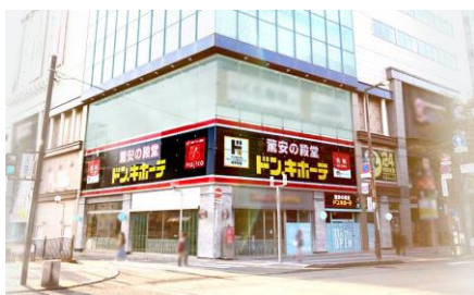
ドン・キホーテ中洲店外観

1階増床部分の大部分を占める「ときめきドンキ」は、Z世代～ミレニアル世代の女性をターゲットにし、ヘアアイロン等の理美容家電や、コスメ、サンリオグッズなどを取りそろえたエリアです。コスメは、日本でまだ取扱いのない商品を主軸に、韓国・アジアコスメを大幅強化するほか、中洲店で部門別売上 No.1 商品を集めたコーナーを作るなど、他店にはない新しい試みで、今までとは一味違うお買い物をお楽しみいただける店づくりとなっています。