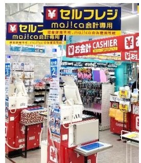
▲majica 会員専用セルフレジ