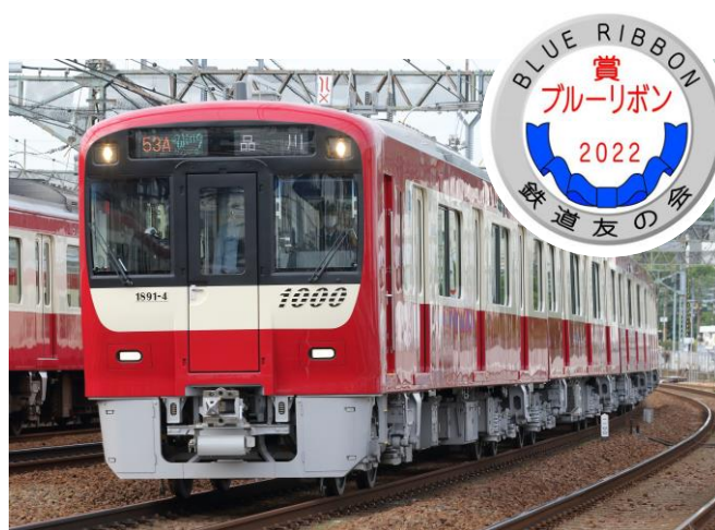
受賞した 1000 形「Le Ciel」車両