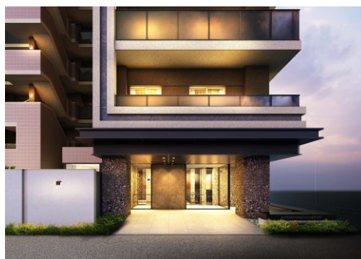
エントランス（イメージ）

本物件は、JR 東海道本線・東海道新幹線「静岡」駅から徒歩13分、最寄りのバス停まで徒歩2分に位置します。東海道新幹線の停車駅として、東京や名古屋など他県へのアクセスも良好です。駅ビルには商業施設「パルシェ」や「アスティ静岡」があり、物件から徒歩10分圏内に、家電量販店、スーパー、ドラッグストアなどの生活利便施設がそろいます。また、徒歩3分圏内に公園があり、県の福祉教育実践校である「静岡市立中田小学校」が学校区であるなど、子育てファミリーにも安心な環境です。