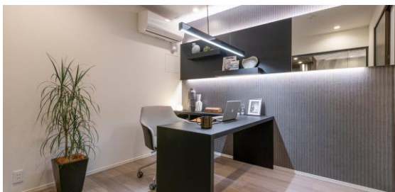
書斎（モデルルーム）