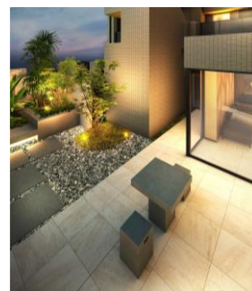
プライベートガーデン（イメージ）

1階には、開放的な大きな窓で外とホール内の一体感にこだわったラウンジや、四季折々の植栽が彩るプライベートガーデンを備えました。入居者さまにくつろぎや安らぎを感じていただける優雅で上質な共用空間をご提供します。