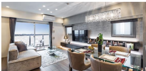
リビングダイニング（モデルルーム）

南西と南東向きの配棟で、間取りは、1LDK～3LDK（55.32㎡～82.55㎡）の6タイプです。全6タイプにて、基本プランにくわえ二つのメニュープランも用意し、単身者からDINKS、ファミリーなど、多彩なニーズにお応えします。クローゼットをワークスペースへ変更したプランや、二つの部屋から使用できるウォークスルークローゼットを追加したプランなど、お客さまのライフスタイルに合わせてさまざまなご提案が可能です。