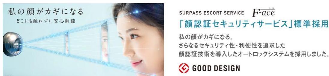
サーパスエスコートサービス F ace (イメージ)

顔認証技術を導入したセキュリティサービス「サーパスエスコートサービス F ace 」を標準採用しています。鍵やカードを使うことなく、顔認証にて共用入口や 1 階エレベーターのセキュリティが解除でき自宅階までのエレベーター自動運転を可能にします。また、宅配ボックスも顔認証で解除可能です。最新のテクノロジーによる安心・便利なライフスタイルをお届けします。