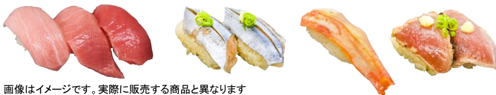
画像はイメージです。実際に販売する商品と異なります

このたびオープンする「DON DON DONKI Jurong Point」では、香港、タイ、マレーシアにおいて現地のお客さまから高い支持を得ている寿司店「鮮選寿司」が監修する寿司コーナーを設けます。こちらでは、ご注文をいただいてからその場で寿司職人が握ったお寿司を提供します。世界中から取り寄せた新鮮なネタと、ネタの旨味を最大限に引き出す寿司飯のコンビネーションをお楽しみください！