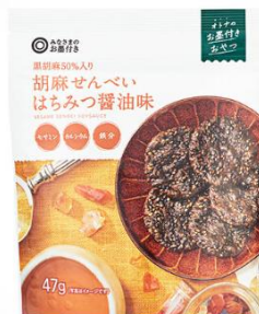
はちみつ醤油味 (支持率：97.3%)