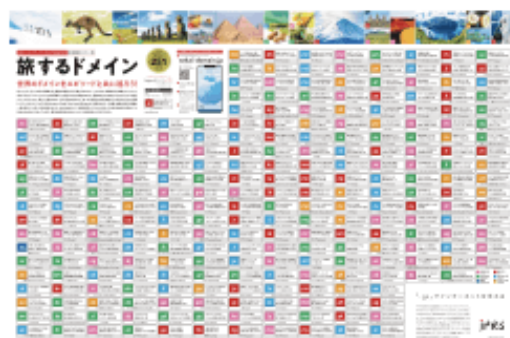
配布 B 『旅するドメイン』