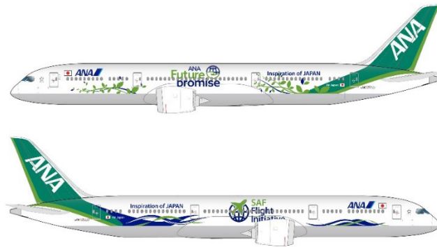
ANA Green Jet 特別塗装機