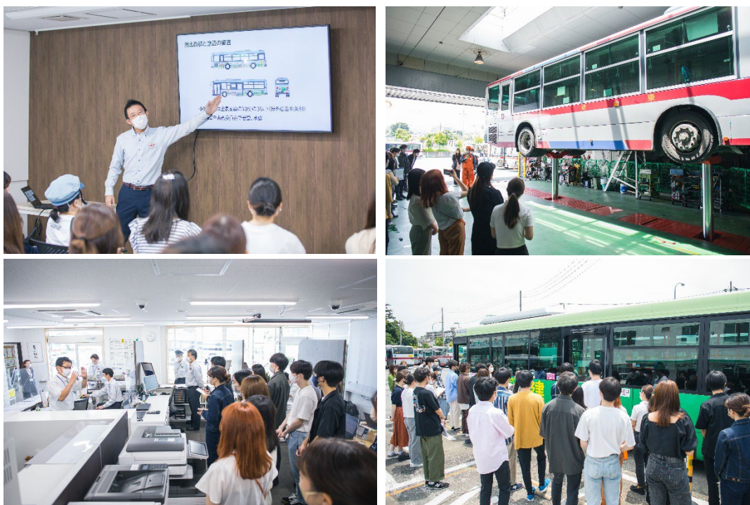
フィールドワークの様子

今回の授業では、6チーム（6人1グループ）から7案のバラエティに富んだデザインが提案されました。