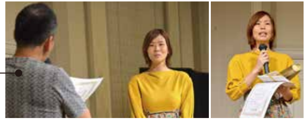
ご参考写真1：営業成績優秀者の表彰式の様子(2020年9月撮影)