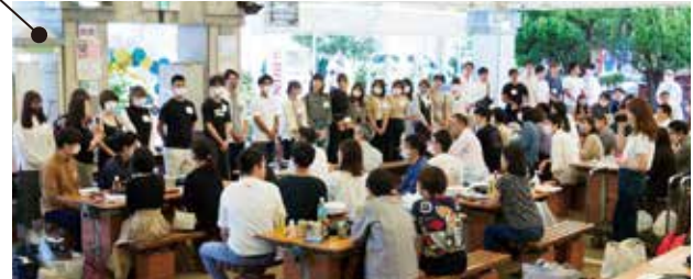
ご参考写真2：内定者歓迎イベント(2020年9月撮影)

内定式は上記のように2日間の日程で行います。内定者は運動会で社員と共に汗を流し、納会では3ヶ月間の営業成績の表彰式(ご参考写真1)も体験。成績、数字、順位という現実をありのまま見ることで会社理解を深め、社会人をよりリアルにイメージすることが出来ます。2日目も内定者を歓迎し交流するイベント(ご参考写真2)を行います。