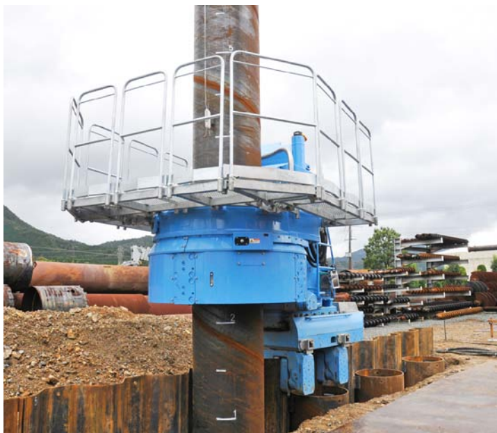
技研製作所／関西工場での実証試験（2013年10月実施）