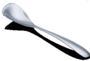
カトラリー ／燕洋食器