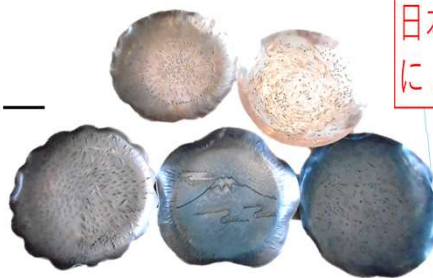
協力：燕市産業史料館