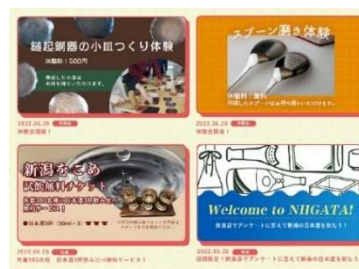
ポータルサイトの一部