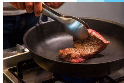
調理器具／三条金属製品