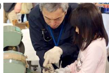
研磨体験の一例