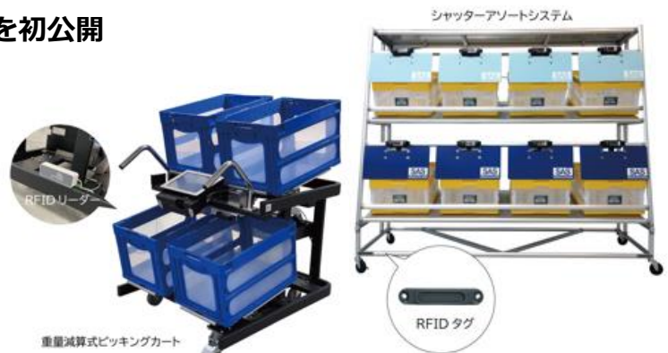
▲重量検品アソートシステム

商品コンテナを積載したピッキングカートがシャッターアソートシステムに近づくと、RFIDを介して商品関連情報を連携。商品を投入する間口のシャッターが自動で開きます。ピッキングカートに表示された商品を指定された数だけコンテナから取り出し、間口に投入して完了ボタンを押せば仕分けが完了。商品の誤投入や数量間違いを防止し、「種まき作業」の効率化・最適化に貢献します。