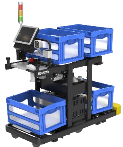
▲自律走行式ピッキングカート (PGKA-4400)

会期中に行う自律走行プレゼンテーションでは、【追い抜き】【オリコンセット】【商品ピッキング】【払い出し】などの一連の作業工程のデモンストレーションを実施します。