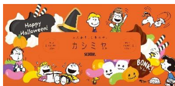
パッケージの天面のデザイン

■「Peanuts ハロウィン」キャラクターのデザイン パッケージは、「スヌーピー」や「チャーリー・ブラウン」など PEANUTS (ピーナッツ) の仲間たちがお菓子の世界に迷い込んでしまい、みんなで仲良くお菓子を食ったりしながら楽しく過ごしているデザインです。オレンジ色を基調としたパッケージの側面の裏表を2段重ねると、クッキーの階段が繋がるデザインでハロウィンを華やかに盛り上げます。