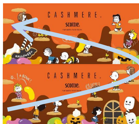
パッケージの側面(表・裏)のデザイン

「スコッティ® カシミア®」は、シートにローションなどを塗布することなく、独自の加工技術でティシュー本来の“ふんわり感”を実現しました。タオルのような“ふんわり”とした使い心地のプレミアムティシューです。