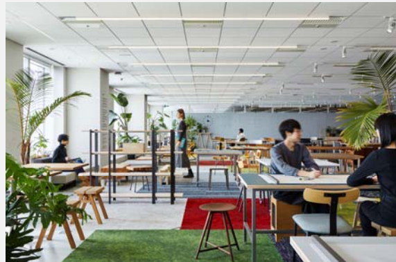
空間デザインに必要なスケール感や素材感などを意識しながらデザインワークをおこなうことができる作業エリア