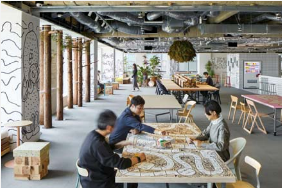
多様で個性的な働き方に合わせて社員が誰でも使える公園のようなRESET SPACE_2（リセットスペース2）

「乃村工藝社は、2021年3月に本社ビル（東京・お台場）に隣接する台場ガーデンシティビル内に、ニューノーマル時代に対応した新オフィスをオープンしました。乃村工藝社グループの多様な働き方や価値観を活かしながら、社員がコミュニケーションを活性化しよりよいクリエイティビティを発揮していくことを掲げています。本プロジェクトは企画・設計・施工・運営まで乃村工藝社グループで実施しています。