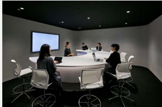
個性的な会議を敢えて積極的に見せる「働き方の行動展示」を試みたCONFERIUM（カンファリウム）