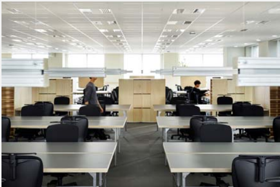
グループアドレスを採用したクリエイティブの執務エリア