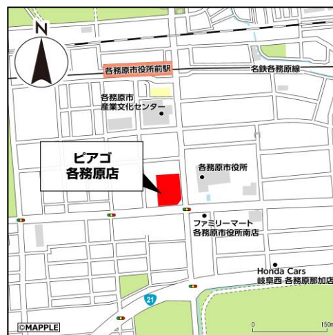
「ピアゴ各務原店」周辺地図

※店舗営業は、地域のお客さまに安心してお買い物をしていただくために、感染予防対策を徹底してまいります。