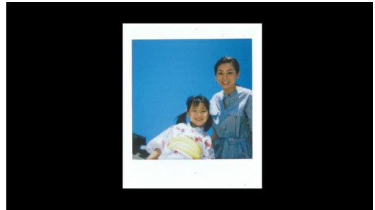
風吹さんが選んだベストショット