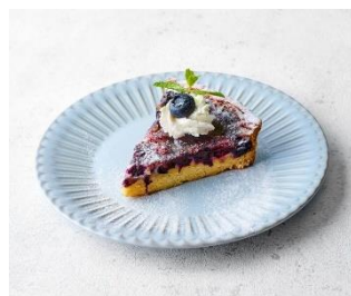
ブルーベリータルト