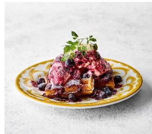
ブルーベリーワッフル