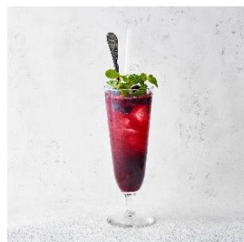
ブルーベリーとフレッシュミント のフルーツソーダ