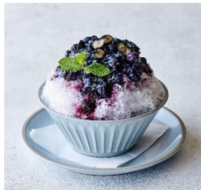
ブルーベリーのかき氷