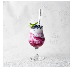
ブルーベリーヨーグルト ドリンク