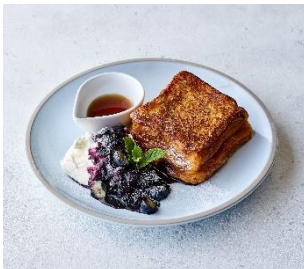
バニラ香るフレンチトースト ブルーベリーソースで