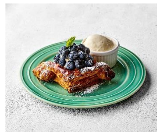
フレッシュブルーベリーパイ