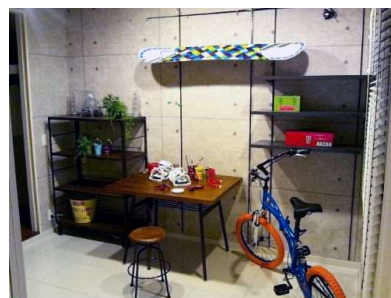
フェスタトリエ（イメージ）

玄関からつながる土間エリア（フェスタトリエ）は、趣味のものの収納や、DIYスペースに利用するなどライフスタイルに合わせて活用できるスペースです。