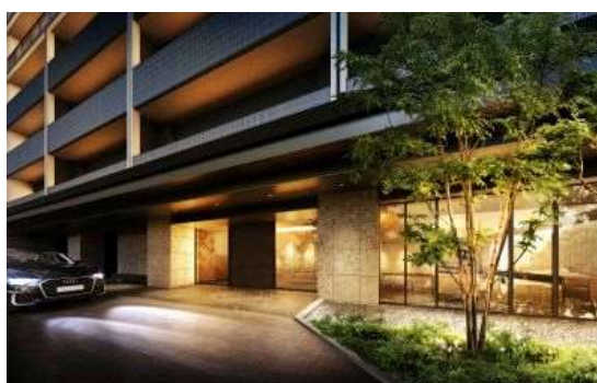
エントランス（イメージ）

本物件は、富山地方鉄道市内電車「西町」電停から徒歩4分、にぎわいにあふれた富山駅南の「総曲輪エリア」に位置します。「総曲輪フェリオ」「SOGAWA BASE」などの商業施設や商店街などが徒歩10分圏内に集まるほか、市の再開発計画「中心市街地基本計画」のもと、路面電車など回遊性のさらなる強化やにぎわい創出などが、今後も期待されるエリアです。