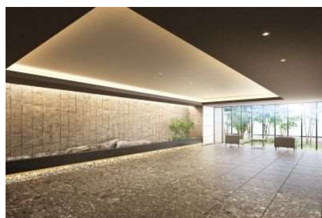
エントランスホール (イメージ)

駐車場は、住戸100%の設置率です。ご自宅や外出先からお手持ちのスマートフォンで、敷地内立体駐車場の出庫予約ができるアプリをご用意しています。天候が悪い日でも少ない待ち時間でスムーズに車をご利用いただけます。エントランス前の車付けスペースには、待機用のベンチ、エントランス内には荷物仮置きボックスなどもご用意します。ボックスは施錠ができるため、手荷物を安全に一時保管できます。