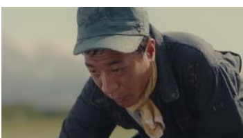
(伊藤さん) 「っていうか、まわりが私に 合わせればよくない？」