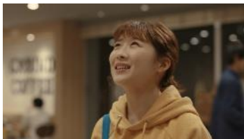
(伊藤さん) 「また、ふるさとの味するかな〜」