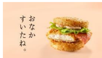
(ナレーション) 夜マックの、ごはんバーガー チキンガーリックベーコン登場。