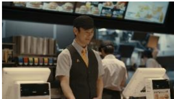
(妻夫木さん) 「新しいごはんバーガー 出ますよ」