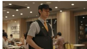
(妻夫木さん) 「そのチキンガーリックベーコン、 コシヒカリに合わせた味に なっております。」