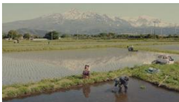
(伊藤さん) 「私さ、まわりと合わすってことが できないんだよね」