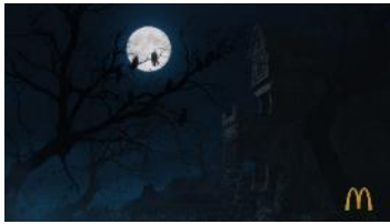
(ナレーション) 夜マック店長。