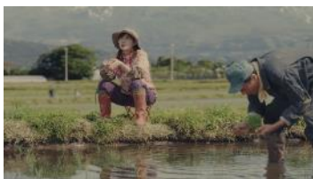
(埴さん) 「協調性は大事だよ」