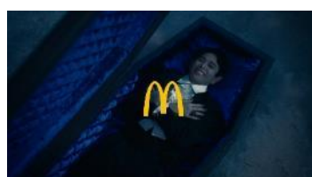
(妻夫木さん) 「そんなことしたら 溶けちゃいます…」