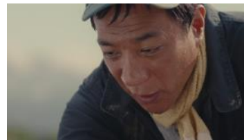
(埴さん) 「わりと女王様キャラ…」