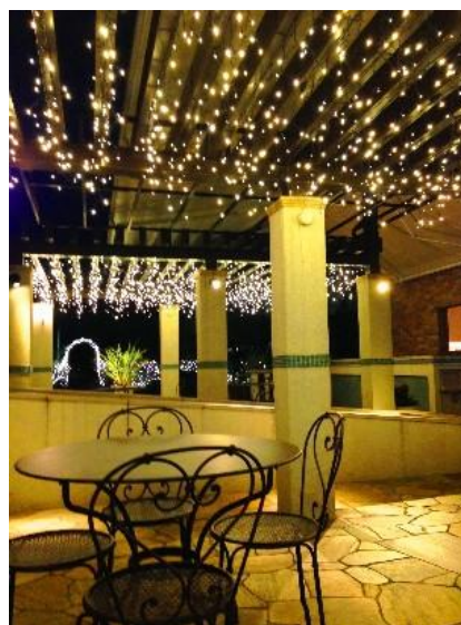
イルミネーション