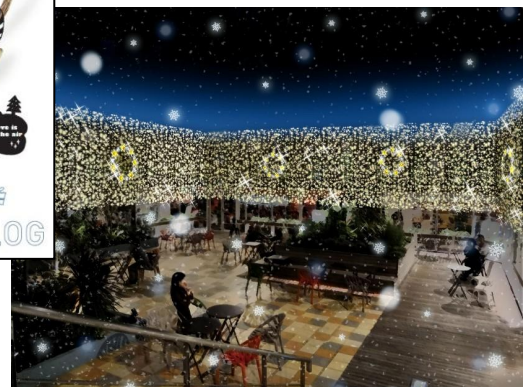
【ルミネ池袋】 Snow Magic イメージ画像

※ 以下のサイトにルミネ各館で行うキャンペーンやイベント情報の第1弾プレスリリースを掲載しております。こちらも合わせてご覧ください。