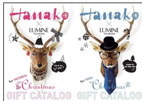
スペシャルギフトブック