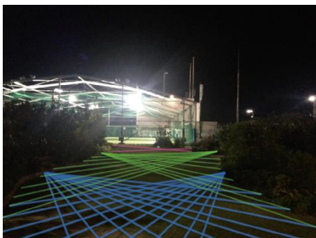
イルミネーション イメージ

【展開内容】 雑誌「Hanako」プロデュースによるギフトブックを発行。各ショップのおススメアイテムだけでなく、ギフト上級者になれるギフトラッピングのポイントも紹介します(3000部限定)。