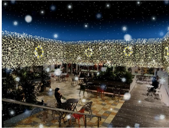
イルミネーションイメージ

【開催内容】 屋上庭園に雪(つぼい泡)を降らせ、イルミネーションと雪の素敵な空間を演出！都会のオアシスにロマンティックなひと時をお客さまにプレゼントします。