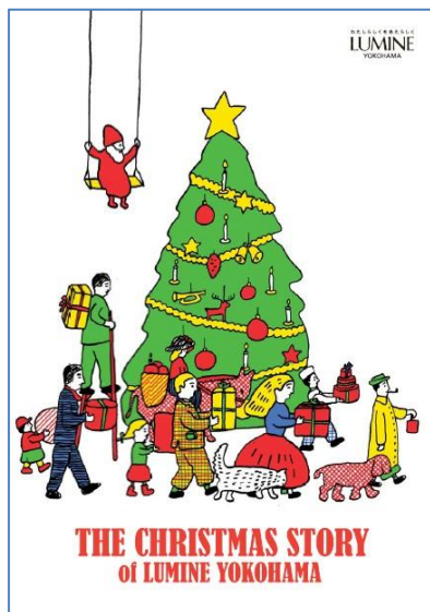
ギフトリーフレット表紙

【開催内容】 屋上庭園ルミネツラがクリスマスイルミネーションであたたかな光に包まれます。夜空とともに眺めてゆったりとした時間をお過ごしいただけます。