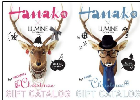
【ルミネ立川】 「Hanako」コラボギフトカタログ