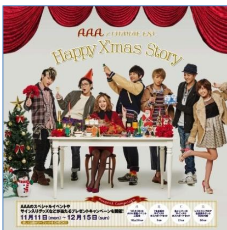
【ルミネエスト新宿】 AAA コラボビジュアル

【ルミネ池袋】では、8Fの屋上庭園に雪を降らせ、イルミネーションと雪の素敵な空間を演出。都会のオアシスにロマンティックなひと時をプレゼントいたします。また、クリスマスギフトにぴったりのアクセサリーショップ2店が期間限定で登場いたします。