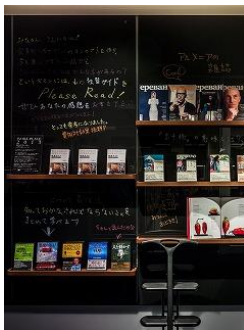
シェアードウォール