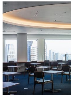
メンバーズカフェ