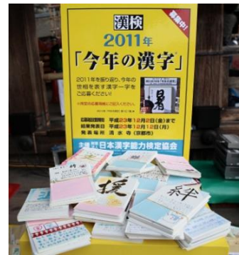
過去の応募はがき(応募の一部) ※発表当日に清水寺にて

公益財団法人 日本漢字能力検定協会(本部:京都市下京区/理事長:高坂節三)は、現在募集中の2013年「今年の漢字」の応募を、来る12月5日(木)に締め切ります。厳正な集計を経て応募数最多となった漢字一字は12月12日(木)に京都・清水寺で発表される運びとなりますので、はがき、ウェブページ、応募箱を通じて奮ってご応募ください。