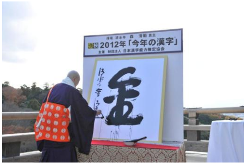
昨年は 258,912 票の応募の中から、9,156 票を集めた「金」が 1 位となりました