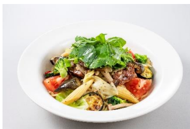
ベジタブル バジリコ ペペロンチーノ