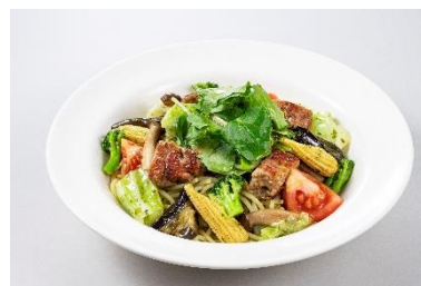
ベジタブル ジェノベーゼ

大豆ミート ※1 でつくった動物性原材料不使用 ※2 の『ゼロミート』は2018年11月に市販用として発売以来、植物由来の素材のおいしさを引き出す研究開発を重ねることにより、食感や味わいが大きく向上しています。また、大豆ミートは健康意識の高まり、人口増加による食糧問題、家畜を育てる際の環境負荷などSDGsの観点から、肉食や中食、外食メニューに採用される機会が増えています。