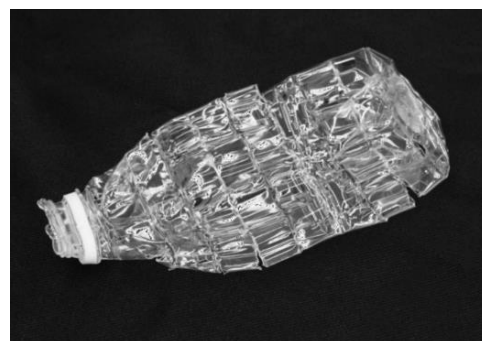
▲プレ裁断圧縮方式により減容したペットボトル

従来機のペットボトル以外の缶や瓶/内容物が残っているボトルを受けつけない機能に追加し、従来機で難しかったラベル・キャップがついたままのボトルの選別もできるようになりました。より綺麗なペットボトルを回収し、効率の良い資源循環に貢献します。