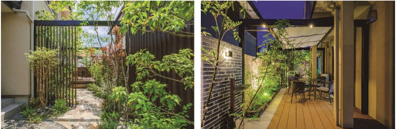
エクステリアコンテスト 2021 の大賞作品 株式会社岡本ガーデンさま（大阪府）

株式会社 LIXIL（以下 LIXIL）は、LIXIL のエクステリア商品をご採用いただいた施工写真を募集し、優秀な作品を表彰する「LIXIL エクステリアコンテスト 2022」( https://www.biz-lixil.com/contest/exterior/ ) を開催します。