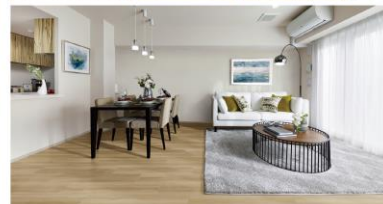
6 チャコールオーク