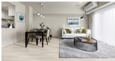
4 アンバーチェリー