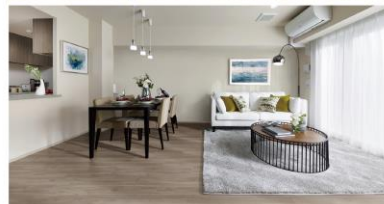
5 テンダーウォールナット