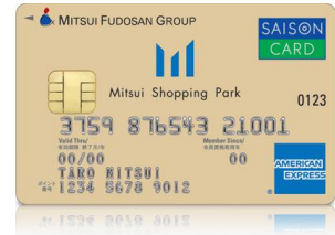
※三井ショッピングパークカード《セゾン》イメージ