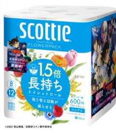
1.5 倍長持ち トイレットロール