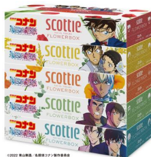
フラワーボックス 5 箱パック