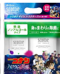
除菌 アルコール/除菌 ノンアルコール