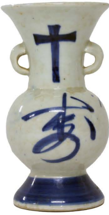
十字文様壺 制作年不明/作者不明/ 西南学院大学博物館蔵