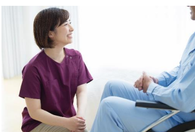
ケアスタッフ(イメージ)

次回の診療日に合わせてホテル予約をスムーズに取れるように、NCC東病院内に本ホテル専用の予約ブースを設置予定。ホテル予約時のご負担を減らします。