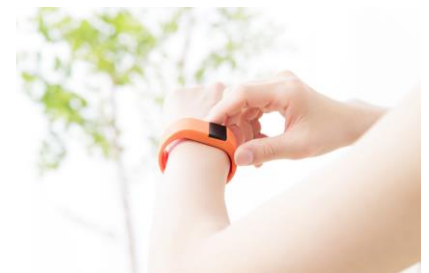
センシングデバイス(イメージ)