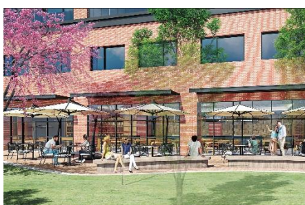
レストランテラス(イメージ)